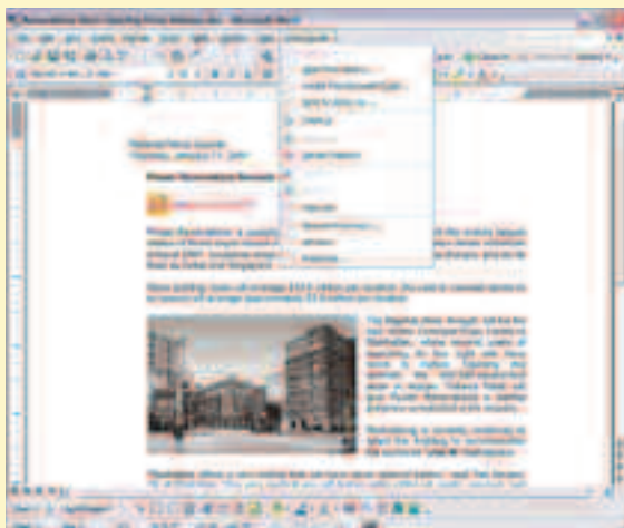
Lotus Quickr connectors allow you to access Lotus Quickr content from within popular desktop applications such as IBM Lotus Sametime, Microsoft Office and Microsoft Windows Internet Explorer software.