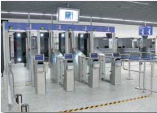
Moderne Kontrollstellen sichern Datenintegrität