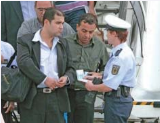
Die Einzelkontrolle bindet viel Personal