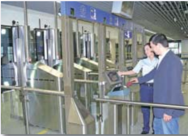
Mehr Komfort für Reisende und bessere Erfassung für die Sicherheitsbehörden

me oder sogar Weiterbildungsstatus erkannt werden, so sind hier entsprechende Chancen für die weitere Verbesserung der Geschäftsprozesse realisierbar. Ein Risikomanagementsystem kann bei der Optimierung helfen und Empfehlungen für die Verbesserung der Dienstplanungen generieren.