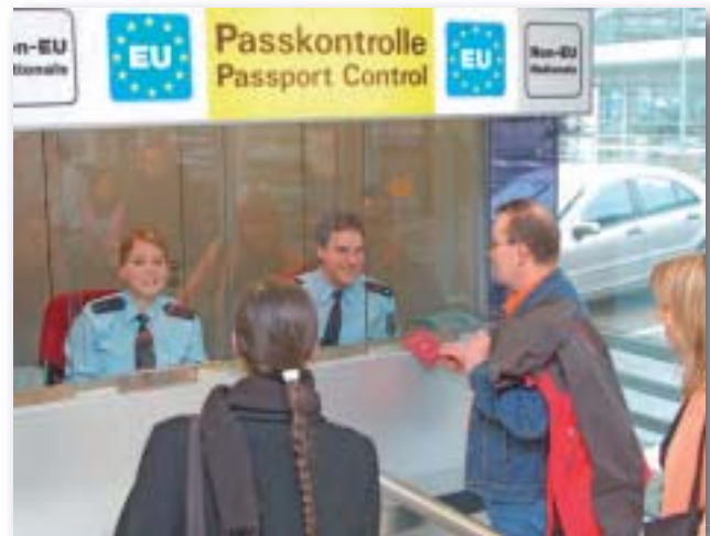
Reguläre Grenzkontrolle am Flughafen

Die hierfür notwendigen und verordneten Kontrollprozesse sind sehr personalintensiv. Jede gesetzliche Änderung greift in die Prozesse ein und zieht teilweise aufwändige Anpassungen